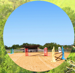
Carrière 35mx60m PTV Douches chevaux

Et de nombreux parcours de randonnée praticables à cheval ou en attelage