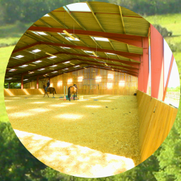
Manège 20mx40m Rond de longe Rond d'Havrincourt