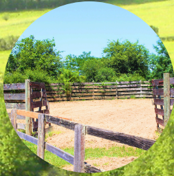
2 écuries avec 13 boxes 3 selleries Aires de pansage