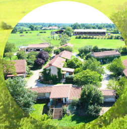
Chambres d'hôtes Camping à la ferme Près et paddocks